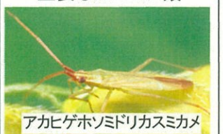
主要なカメムシ類