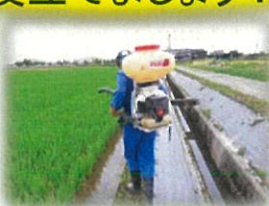
用水路沿いの動噴散布作業