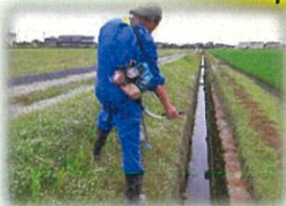
用水路沿いの草刈り